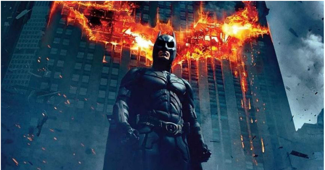
Görsel 6. Christopher Nolan, The Dark Knight (Kara Şövalye), Batman, 2008.

Gerçekliği idealize eden sanat, toplumu ideolojilerin ekseriyetinde kucaklamayı reddeder. Sanat bir başkaldırıdır anarşizmi bünyesinde barındırmasının en büyük nedeni empoze edilmekte olan gerçekliği aynı şiddetle reddetmektedir. Sanat, gerçekliğe karşı çıkmak ve özgürlük hedeflerine ulaşmak için etkili bir iletişime duyulan ihtiyacın ifadesidir. Bir diğer açıdan anarşist sanat, sanatta var olan kriterlere