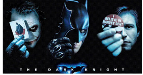
Görsel 5. Christopher Nolan, The Dark Knight (Kara Şövalye), 2008.

“Anarşistlere göre devlet daima bir katlaşma, bir nasırlaşmadır (Meriç, 1999, s.135)” . Anarşizm insanlık için başlı başına bir tehdit olan otoriteyi yıkmak ister. Joker karakteri, burjuvazi toplumların iki yüzünlüğünün altını çizerek, en saf halinde anarşizmi istemektedir. İyi ve kötü değişken bir tabir iken doğru tektir. Joker iyi ve kötü olmayı benimsemez doğru yolu izlemeye devam ederek devlet ideolojisinin taktığı maskenin hükmünü geçersiz kılmaktadır. Her birey söz hakkı sahibidir halkın sesini kısarak kendini yücelten devlet anlayışı Žižek'in tabir ettiği gibi bir ideoloji çöplüğüdür. Devlet halka şu mesajları verir; bir ulus gücü eline geçirirse toplumsal adalet ihtiyacını vurguladığı gösterimler ile bir kitlenin eline geçerse neye dönüşeceğini aktarmaktadır. Sonuç olarak Kara Şövalye filmi, izleyicilerin yaşamlarında sıklıkla karşılaştığı adaletsizliğe karşı savaşıyor, ideolojik davaları olan devrimcilerin nasıl olacağını göstermektedir. Hollywood endüstrisi anlatılmak