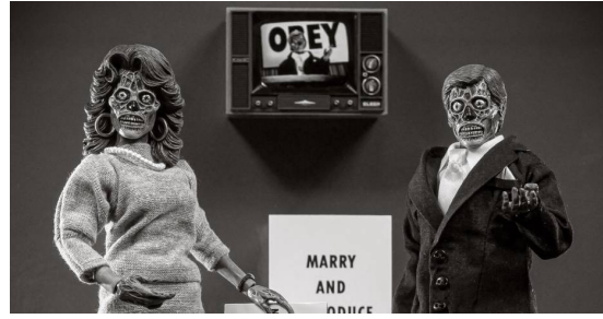
Görsel 4. John Carpenter, They Live (Yaşıyorlar) , 1988.

Žižek sisteme ve yalanlara karşı çıkan Joker karakterini gözler önüne sermektedir. 2008 yapımı Christopher Nolan'ın yönetmenliğini yaptığı The Dark Knight (Kara Şövalye) filminin ideolojik yalanları Joker karakteri sayesinde ortaya çıkmaktadır. Kara Şövalye filminin en rahatsız edici yanı ise yalanı basite indirgeyip yasal hale getirmesidir. Yalan adeta gerçek yaşamın politik ve sosyal düzeyde gerekliliği olarak izleyiciye aktarılmaktadır. Burada yatan asıl ideoloji, toplular yalnızca bir yalan üstüne temellerini atarsa düzen sağlanacaktır, gerçekler söylenirse düzen topyekûn sarsıntıya uğrayacaktır. Joker gerçekleri bozguna uğratarak