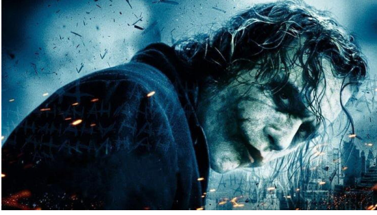
Görsel 7. Christopher Nolan, The Dark Knight (Kara Şövalye), 2008.