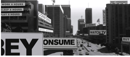
Görsel 3. John Carpenter, They Live (Yaşıyorlar) , 1988.

Angeles'ta dolaşırken kullanıma kapatılmış bir kiliseye gider ve burada içi güneş gözlükleri ile dolu olan bir kutuya ulaşır. Güneş gözlüklerinden birini takarak reklam afişlerine baktığında altında ideolojik bir propagandanın yattığını ve bu gözlüklerin asıl mesajının ideolojiler tarafından gizlenmiş gerçeği göstermek olduğunu anlar. "Kendinizi ideolojiden kurtarmak, özgürleştirmek ve gerçekliği olduğu gibi görmek için gözlükleri çıkarmanız değil, tam aksine gözlükleri takmanız gerekir. İnsan doğası yoz ve kirlidir; doğal hale geri dönmek diye bir şey yoktur, doğal varlıklar olarak dünyaya baktığımızda bakışımız ideolojiktir (Fiennes, Sapiğin İdeoloji Rehberi , 2012)". Toplular ideolojilerin istekleri doğrultusunda şekillenmektedir. Bu uğurda pek çok değerlerimizi yitirdiğimiz kabul etmeye mahkûm olduğumuz bir gerçektir. "Gerçek bakış açımızı bulandırır, ideoloji bizlere basit bir şekilde empoze edilmez. İdeoloji denen şey sosyal dünyayla sürekli ve olarak geliştirdiğimiz ilişkidir (Fiennes, Sapiğin İdeoloji Rehberi , 2012)". Sinema bünyesinde muhalif değerleri barındırmaktadır. Sinemanın devrimi hiç şüphesiz anarşizm ile olacaktır.