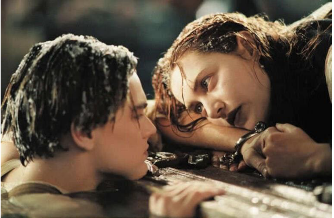
Görsel 2. James Cameron, Titanik , 1997.

Žižek'in ideolojik bağlamda incelediği Yaşıyorlar filmi 1988 yapımı solcu Hollywood'un en büyük yapıtlarından ve zamanla unutulmuş şaheserlerinden biridir. Filmde John Nada'nın hikâyesi anlatılmaktadır. Nada İspanyolcada 'hiç' anlamına gelmektedir. Buradaki hiçlik kavramı tüm diğer konuların önüne geçen ana temadır. Filmde izleyiciye bir işçi olarak sunulan Nada Los