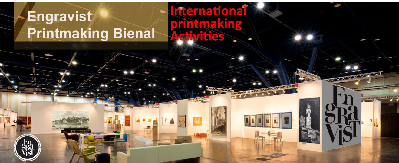
Resim 4. Engravist Uluslararası Baskiresim Etkinlikleri, engravist.art

Modernleşme sonrasında yeni teknolojiler ve toplumsal travmalar ile yaşamı köklü değişimlere uğrayan günümüz insanı, modern akla olan inancını kaybederek hızla kendine yabancılaşmış ve kimlik bunalımına doğru sürüklenmiştir. Aydınlanmanın özgürleştirici vadinin tersine dönmesi, modernizmin unutkanlık so-