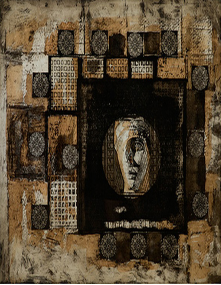
Resim 2. Lütfü Kaplanoğlu, 'Hazine', lutfu-kaplanoglu.com

Gravürün katmanlı ve geçişli dokusunu açık olarak görebildiğimiz resme kahverengi ve toprak renginin sıcak tonları hâkimdir. Sağ orta merkezde duran siyaha yakın büyük karenin ortasında bir daire ve dairenin içinde antik Yunan büstünü gösteren bir desen görülmektedir. Resmin genelinde eskimiş, yıpranmış bir etki gözlenmektedir.