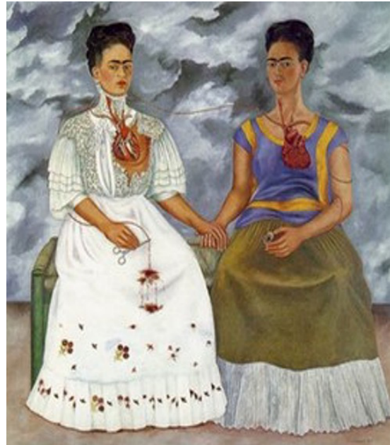
Resim 5. Frida Kahlo, "İki Frida", 1939 (Lindauer, 2014).

ve anneliği evrensel bir sevgi ve bağlılık simgesi olarak ifade etmektedir (Ertaş, 2004). Frida Kahlo'nun otoportreleri, feminist sanat akımı bağlamında bireysel ve toplumsal kadın deneyimini, acıyı, yıkımı ve yeniden doğuşu sembolik bir dille anlatma biçimiyle önemlidir. Otoportrelerinde bedenini ve kişiliğini açıkça ve cesurca sergileyen Frida Kahlo, geleneksel toplumsal cinsiyet rollerini ve estetik idealleri sorgulamaktadır. Kıyafetler, takılar ve özellikle de bedeni üzerinde yer alan tüyler, bedeninin gerçekçi ve sansürsüz temsiliyle fe-