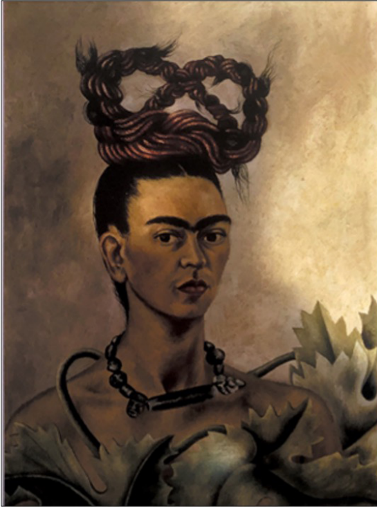
Resim 2. Frida Kahlo, "Saç Örgülü Otoportre", 1941 (Gelman Koleksiyonu, 2010)

Frida Kahlo, bu otoportresinde kendini egzotik ve dik başlı biri olarak resmetmiştir. Frida Kahlo'nun resimde giysisi yoktur ve korunmasızdır, sadece çıplaklığını örten bir üzüm asması vardır. Asma yaprağı cennet giysisi sayılmış ve Frida Kahlo'nun da sık sık kullandığı semboller arasında ölümsüz aşkı simgelemektedir. Eski taşlardan oluşan kolyesinde, erkek kafası şeklinde bir taş vardır. Bu taş, eşi ile barışıklarının bir göstergesi olmuştur. Ayrıca Frida Kahlo, bu resmini eşi ile ikinci kez evlendikten hemen sonra yapmıştır. Frida Kahlo'nun erkekle dişi arasına yerleştirdiği uzun taş ise yakınlaşmayı engellediğini belirtmiştir. Bunun nedeni Frida Kahlo ve eşi ikinci evliliklerinde cinsellikten uzak durmaya karar vermeleridir. Buna ek olarak ifade etmek gerekirse; esere adını veren fantastik saç modeli, başın üstünde dimdik duran saç örgüsüdür. "Oaxaca" yöresinde Chinantla'da yaşayan genç kızlar saçlarını, bu kendi-