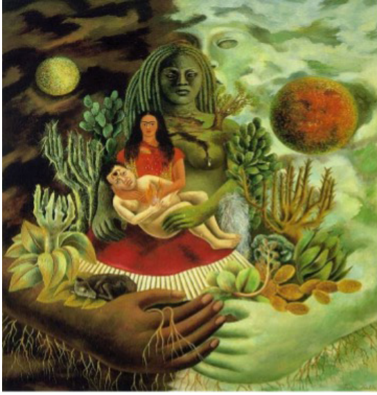
Resim 6. Frida Kahlo, "Evrenin Aşk Kucaklayışı", 1949 (Gelman Koleksiyonu, 2010).

minist bir direnişi ifade etmektedir. Ayrıca, ıstırap ve acıyı çoğunlukla doğurganlık ve annelikle ilişkilendirilen kadın bedeni üzerinden resmederek, kadın deneyimini sorgulamakta ve genişletmektedir. Bu nedenle, Frida Kahlo'nun otoportreleri, sadece kişisel tarihini ve yaşam deneyimlerini yansıtmakla kalmamakta, aynı zamanda feminist bir bakış açısıyla kadın kimliğinin ve deneyiminin daha geniş bir incelemesini sunmaktadır.