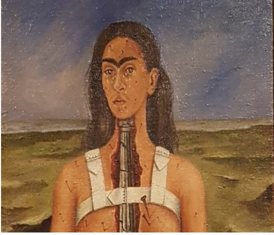
Resim 4. Frida Kahlo, "Kırık Sütun", 1944 (Artincontext, 2022).

Genel olarak bir değerlendirme gerçekleştirildiğinde, Frida Kahlo'nun otoportrelerinde kadınsılığın çeşitli yönlerini ifade eden güçlü bir tema bulunmaktadır. Örneğin; "Kırık Sütun" adlı eserinde Frida Kahlo, bedeninin fiziksel acısını ve kırılganlığını çıplak bir şekilde tasvir etmektedir. Bu tasvir, kadınsılık ve bedensellik konusundaki sosyal normlara ve beklentilere meydan okumaktadır. Bu eser 1944 yılında, 18 yaşında yaşadığı ağır trafik kazasının yol açtığı komplikasyonları tedavi etmek amacıyla geçirdiği omurilik ameliyatının hemen sonrasında, yağlı boya tekniğiyle masonit üzerine çizdiği tablodur (Artincontext, 2022).