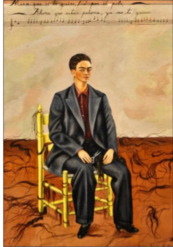
Resim 3. Frida Kahlo, "Kırılmış Saçlı Otoportre", 1940 (Öcal, 2020).

Tepki olarak da ataerkil toplumun kadınsı bulmadığı hatta çirkin olarak nitelendirdiği özellikleri ön plana çıkararak onları bu eserinde de yansıtmıştır. 'Bana ait en güzel şey' olarak betimlediği kaşları ve bıyıklarını almaması onun genel normlara baş kaldıran karakterini göstermiştir (Öcal, 2020).